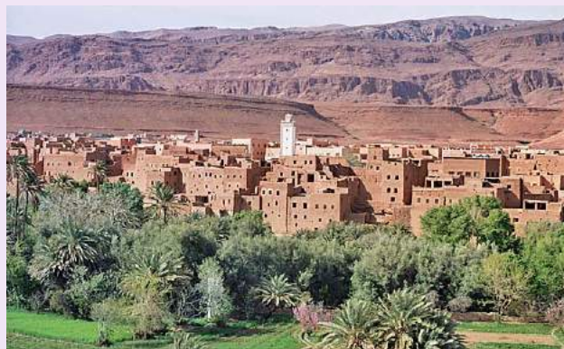
Vallata del Dadès