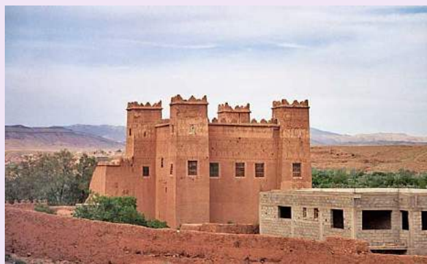
Vallata del Dadès