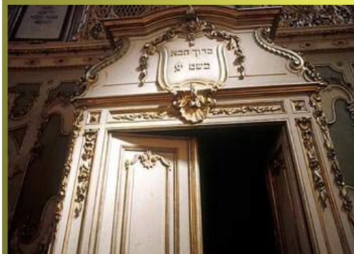
Iscrizione di benvenuto sopra la porta di ingresso della Sinagoga di Casale Monferrato.