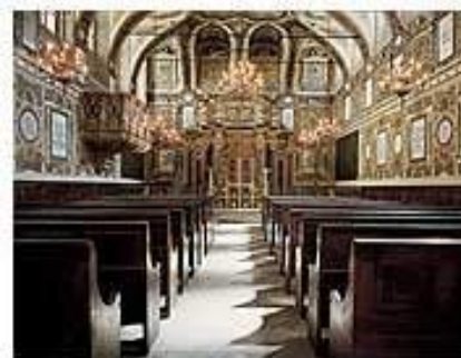
Interno della Sinagoga