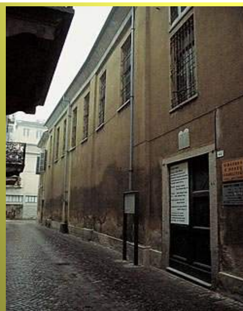
Vicolo Olper 1, Casale M.

Era questa una cosa molto importante in un periodo di persecuzioni religiose e di segregazione.