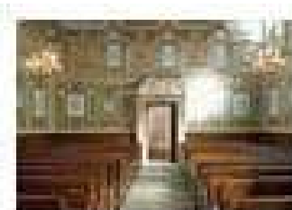
Interno della Sinagoga