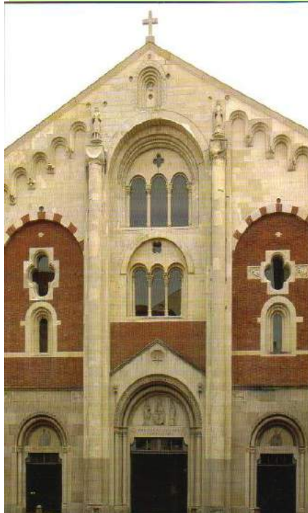
Il Duomo di Casale M.

Questa è stata l'ultima tappa della nostra visita al Duomo; infatti subito dopo averli osservati ci siamo incamminati verso la Sinagoga ebraica. Per la strada un nostro compagno ha ricevuto il regalino di un piccione sulla spalla mentre noi, durante il tragitto dal Duomo alla Sinagoga, abbiamo potuto ammirare i bellissimi negozietti chic di Casale.