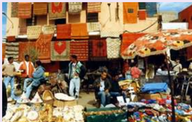
La Medina di Marrakech